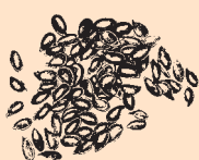
Brytyjskie brązowe siemię lniane