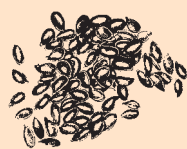
Brytyjskie brązowe siemię lniane